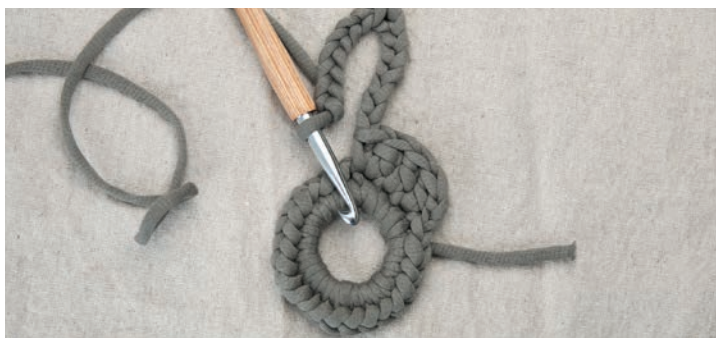
7 Lm zurück arbeiten