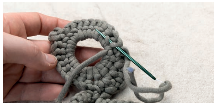
Die Fäden vernähen