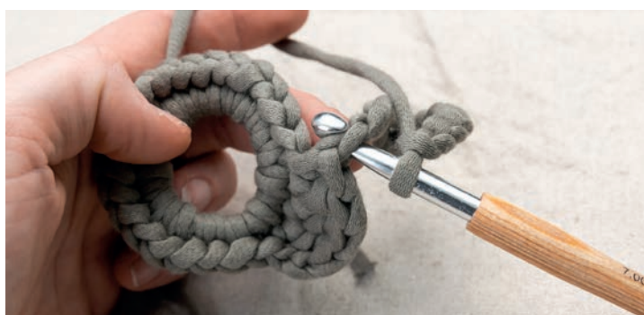
Mit einer Km das 1. Ohr in der fM fixieren