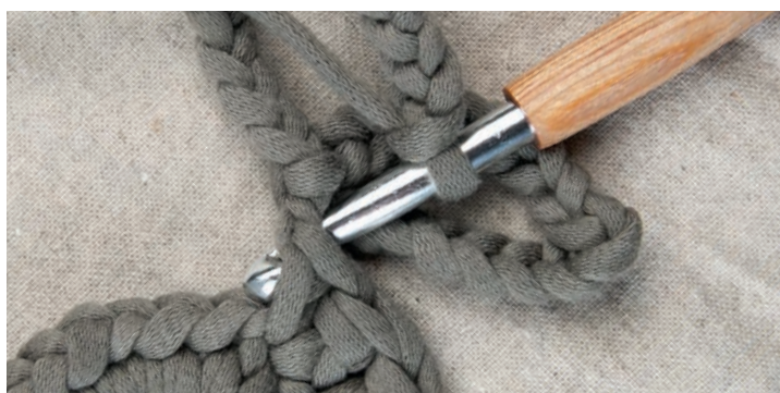
Das 2. Ohr wie das 1. Ohr arbeiten; eine Km in die fM