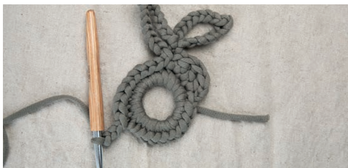
Nun in den 10 folgenden M Km arbeiten.